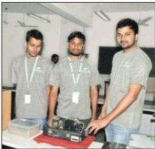
భూకంపాలకు సంబంధించిన అంశాలను వెల్లడిస్తున్న విద్యార్థులు