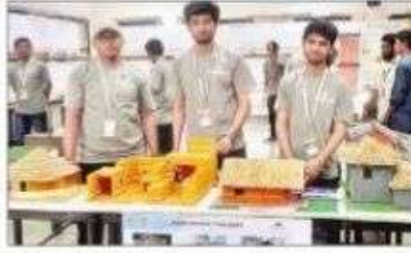
పురాతన కాలం నాటి ఇళ్లను ప్రదర్శిస్తున్న విద్యార్థులు

రాయదుర్గం: ట్రీపుల్ ఐటీలో నిర్వహించిన రెండు రోజుల రీసెర్చ్ అండ్ డెవలప్ మెంట్ షోకేస్-2017 కార్యక్రమం ఆదివారం ముగిసింది. గచ్చి బాలిలోని ట్రీపుల్ ఐటీలో ఆర్ అండ్ డీ షోకేస్ ఎగ్జిబిషనల్ 20 పరిశోధనా సంస్థల ద్వారా 337 ఎగ్జిబిట్లను ప్రదర్శనలో ఉంచారు. ఏడాది పొడవునా విద్యార్థులు చేసిన పరిశోధనలతో రూపొందించిన వాటిని ఈ ప్రదర్శనలో ఉంచడం ఆనవాయితీగా వస్తోంది. ప్రధానంగా భూకంపాలకు తట్టుకొని ఇళ్ల నిర్మాణం ఎలా నిర్మించుకోవాలో ఎర్త్ క్వేక్ ఇంజనీరింగ్ రీసెర్చ్ సెంటర్ ద్వారా ఏర్పాటు