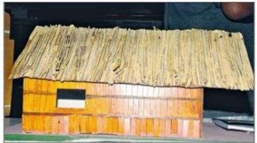
బిల్డింగ్ సైన్స్ విభాగంలో ప్రదర్శించిన ఇంటి నమూనాలు