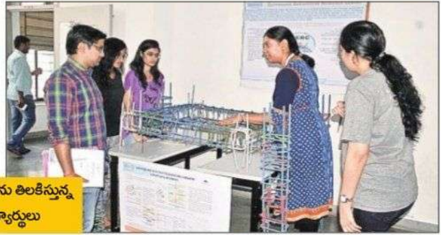
ప్రదర్శనను తిలకిస్తున్న విద్యార్థులు